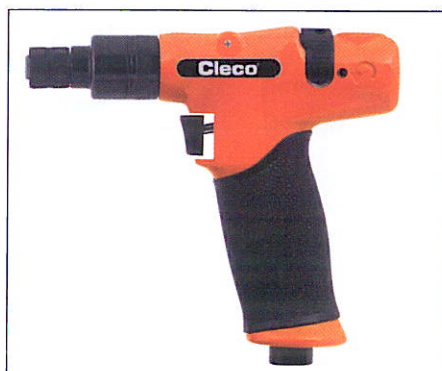
Cooper / Cleco® Luchtgereedschap

gen zijn bijvoorbeeld DoFast® schroeven met onverliesbare ringen, reactievrij gereedschap, schroefhoppers, of Apex hulpstukken voor het verwisselen van verschillende maten krachtdoppen. Tijdens zo'n onderzoek komen we van alles tegen. Van onveilige werksituaties, trillingen, herrie tot verkeerde bits. Met onze voorstellen helpen we aan een betere ergono-