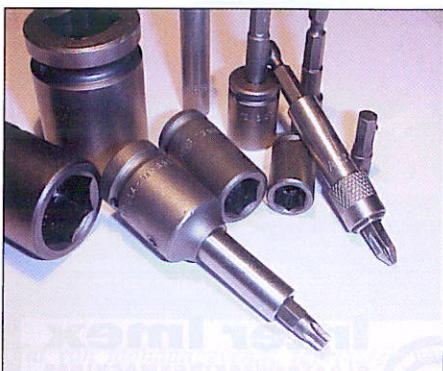
Apex® bits en krachtdoppen

"We adviseren de klant altijd dat product dat hem het meeste rendement oplevert. We denken dus niet in producten, maar in oplossingen. Van de top 100 assemblage-bedrijven werkt 95% met onze producten. We leveren bijv. Apex krachtdoppen met hoge passing en tot 50 maal langere standtijd. Deze gepatenteerde krachtdoppen hebben desgewenst kunststof ommantelingen en veroorzaken dus geen beschadiging, en beschikken over een ideale balans van taaiheid en hardheid. Met onze SecuFast anti-diefstal schroeven zijn we de grootste in Europa. Eigenlijk te veel om op te noemen."