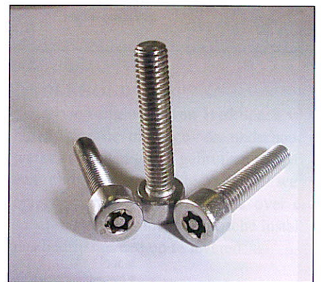
SecuFast® anti-diefstal schroeven

mie en bestrijding van RSI. We vatten de verbetervoorstellen samen in een rapport en stellen dat aan de klant ter beschikking. Onze mensen zijn specialisten in hun vak die gemiddeld meer dan 20 jaar ervaring hebben. Zij geven echt advies aan de klant zodat deze ook een oplossing heeft voor zijn probleem. We gaan er niet vanuit dat klanten bij ons zomaar uit een dikke catalogus bestellen. Je verdiepen in de situatie van de klant en daarvoor een goede oplossing bieden; dat is onze aanpak."